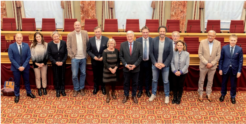
Mme Laurence Fehlmann Rielle (6 e à gauche), membre du Comité des droits de l'homme des parlementaires de l'Union interparlementaire (UIP), entourée de députés luxembourgeois

La protection des droits humains des parlementaires était au centre d'un échange de vues, le 25 novembre 2024, entre les députés luxembourgeois et Mme Laurence Fehlmann Rielle, députée suisse et membre du Comité des droits de l'homme des parlementaires de l'Union interparlementaire (UIP).