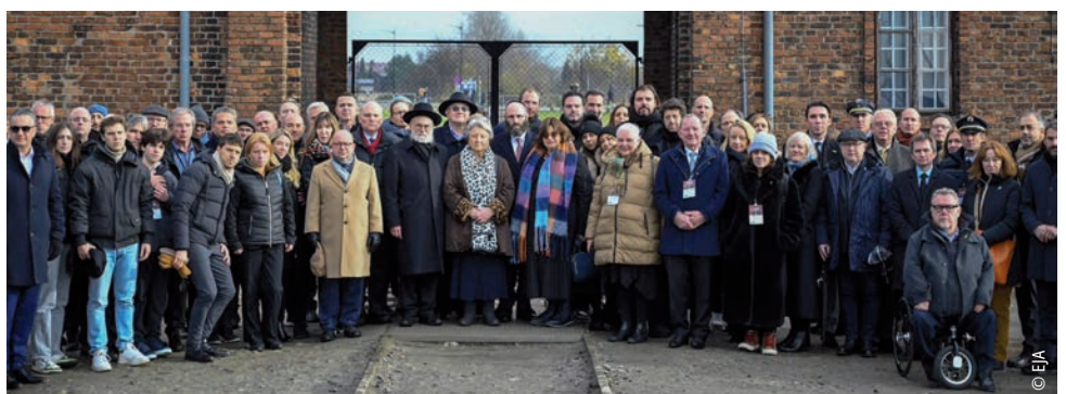
M. Fernand Etgen, Vice-Président de la Chambre des Députés, lors de la visite solennelle du site d'Auschwitz-Birkenau

Dans le cadre des commémorations du 80 e anniversaire de la libération du camp de concentration d'Auschwitz, M. Fernand Etgen, Vice-Président de la Chambre des Députés, a pris part au symposium organisé par le « European Jewish Association (EJA) » les 18 et 19 novembre 2024 à Cracovie en Pologne. Cet événement, qui s'est déroulé sur deux jours, a abordé des sujets majeurs tels que le lien entre antisémitisme et antisémitisme, le rôle des universités comme lieux de libre expression ou, au contraire, de propagation de la haine, ainsi que l'importance cruciale de l'éducation sur la Shoah. Le symposium s'est achevé par une visite solennelle du site d'Auschwitz-Birkenau, ponctuée d'une cérémonie commémorative en hommage aux victimes de la Shoah.