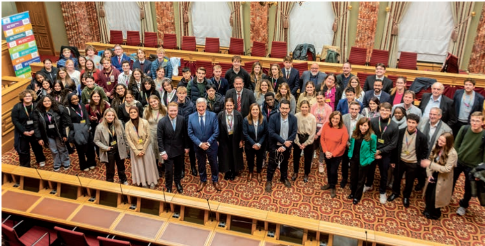
Dans quatre ateliers différents, les jeunes ont eu l'occasion d'échanger avec les membres de la Chambre des Députés.

À l'occasion du « Jugendkonvent », des jeunes entre 13 et 30 ans se sont rendus au Parlement le 15 novembre 2024 pour échanger avec les députés sur des