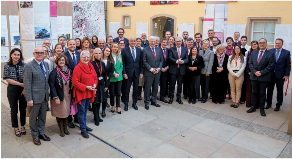
Une soixantaine de députés internationaux membres de l'Assemblée parlementaire du Conseil de l'Europe réunis à Luxembourg

Une soixantaine de députés internationaux des 46 États membres du Conseil de l'Europe s'étaient réunis à l'Abbaye de Neumünster à Luxembourg le 29 novembre 2024 pour marquer le début de la présidence luxembourgeoise de cette institution, garante de l'État de droit sur le continent européen. Les discussions ont principalement porté sur les droits humains menacés en Azerbaïdjan ainsi que sur l'ingérence étrangère, notamment dans les processus électoraux. Les parlementaires ont encore exprimé leurs préoccupations face à la situation en Géorgie, où le Gouvernement a annoncé la suspension des négociations d'adhésion avec l'Union européenne.