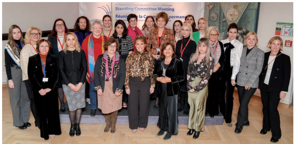
En tant que Présidente de l'association « Stand Speak Rise Up! », S.A.R. la Grande-Duchesse a eu un échange de vues avec des parlementaires sur les violences de guerre perpétrées contre les femmes.

Les itinéraires culturels du Conseil de l'Europe, initiés en 1987, promeuvent le patrimoine européen à travers 47 itinéraires thématiques, favorisant le dialogue interculturel et l'unité entre les nations. Ce programme sert de plateforme pour la paix, la réconciliation et le développement durable, comme souligné dans la Résolution 2488 (2023) de l'Assemblée parlementaire du Conseil de l'Europe.