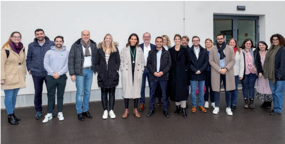
Les députés membres de la Commission de la Famille, des Solidarités, du Vivre ensemble, de l'Accueil, de l'Égalité des genres et de la Diversité ont visité les lieux de la « Wanteraktioun ».

L'Action Hiver – « Wanteraktioun » – accueille des personnes sans abri pendant les mois d'hiver afin de leur permettre de dormir à l'abri du froid et de leur offrir un repas chaud. À l'occasion de la visite récurrente de la Commission de la Famille, des Solidarités, du Vivre ensemble, de l'Accueil, de l'Égalité des