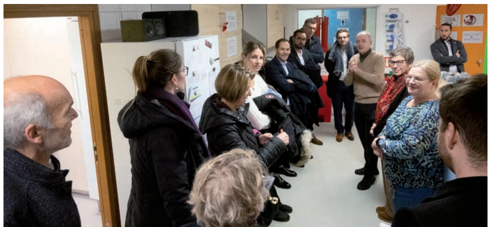
Les députés des commissions en charge de la famille et de la santé ont visité les locaux de l'Abrigado.

Ici, elles peuvent s'échanger avec des membres féminins du personnel et profiter de l'offre d'acupuncture, de maquillage ou de relaxation. L'atelier de maquillage vise à promouvoir le rétablissement du respect de soi-même et offre aux femmes une activité qui peut les aider à prendre leur distance à l'égard de leur vie quotidienne, marquée par la prostitution par exemple. Cet espace est réservé aux femmes les lundis, de 10.30 heures à 17.30 heures, afin de permettre à celles qui travaillent la nuit d'avoir un lieu de repli.