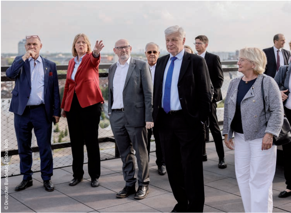
Les Présidents des Parlements germanophones découvrent Duisbourg, ville natale de la Présidente du Bundestag allemand.

Un des sujets clés de la septième conférence annuelle du forum d'échange entre les Présidents des Parlements germanophones les 17 et 18 juillet 2024 à Duisbourg était l'actualité internationale, notamment la guerre en Ukraine et le conflit au Proche-Orient. Mais le thème qui était avant tout au cœur de cette rencontre était la désinformation et l'impact de l'intelligence artificielle sur la politique démocratique.