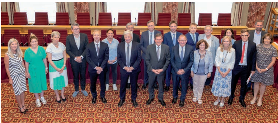
Bon nombre de députés ont participé à l'échange de vues avec le Représentant spécial de l'Union européenne pour le processus de paix au Proche-Orient, M. Sven Koopmans (5 e à gauche).

Contribuer à créer un processus de paix pour le Proche-Orient est la mission clé de M. Sven Koopmans. Lors d'un échange de vues le 15 juillet 2024 à la Chambre des Députés, le Représentant spécial de l'Union européenne pour le processus de paix au Proche-Orient a partagé son aperçu du conflit avec les députés luxembourgeois.