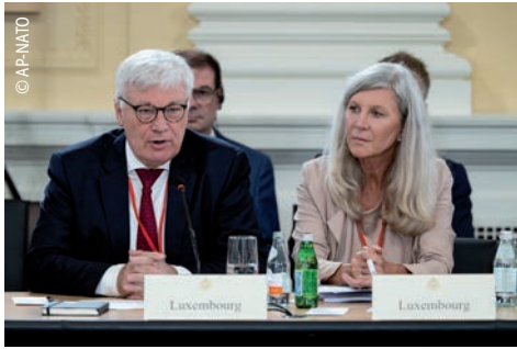
Le Président de la Chambre, M. Claude Wiseler, et Mme la Députée Nancy Arendt au sommet parlementaire de l'OTAN à Washington.

environnement de sécurité de plus en plus complexe. Le Luxembourg se classe déjà 8 e pays pour l'investissement en défense par habitant, a encore précisé le Président de la Chambre lors de cet événement d'envergure.