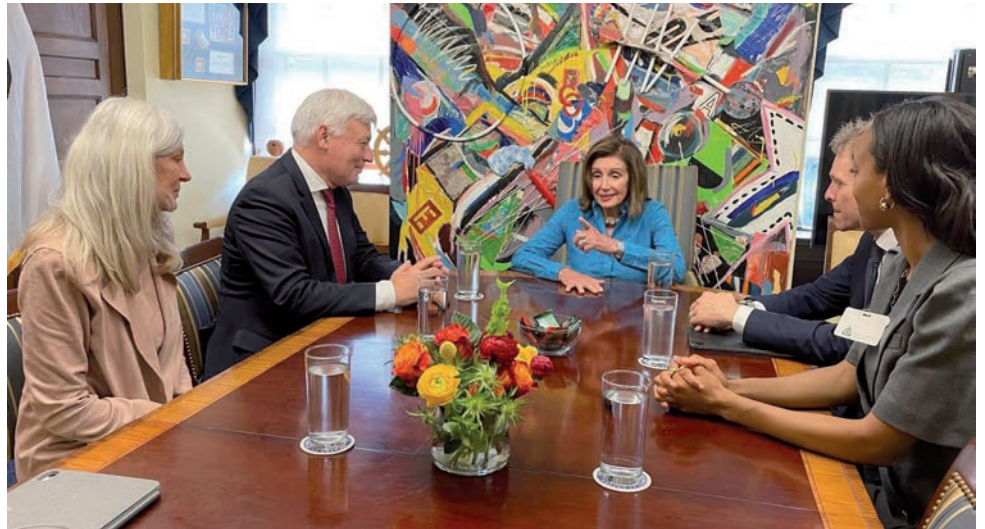
Les membres de la délégation luxembourgeoise lors d'un entretien avec Mme Nancy Pelosi

Le programme comprenait également une visite au cimetière national d'Arlington, où la délégation luxembourgeoise a déposé une gerbe, ainsi que des échanges avec des experts sur l'intelligence artificielle.