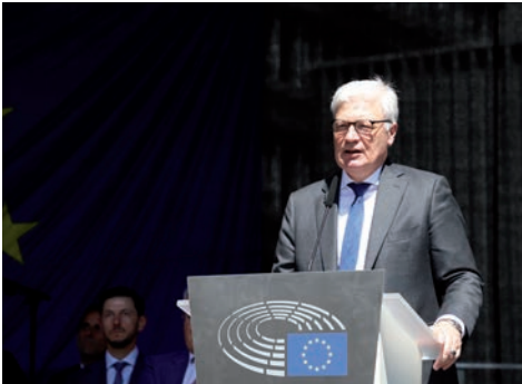
Le Président de la Chambre des Députés, M. Claude Wiseler, a rappelé l'importance de défendre les valeurs démocratiques.

« Il faut se battre tous les jours pour défendre la démocratie ! » Tel fut le message central que le Président de la Chambre des Députés, M. Claude Wiseler, a adressé aux citoyens lors de la fête de l'Europe le 9 mai 2024, à un mois des élections européennes. Le Parlement luxembourgeois a accueilli des centaines de citoyens à son stand à la fête populaire organisée au Kirchberg. Rappelons que la Journée de l'Europe a été déclarée jour férié au Luxembourg le 27 mars 2019 par la Chambre des Députés, ce qui fait du Luxembourg une exception parmi ses pairs.