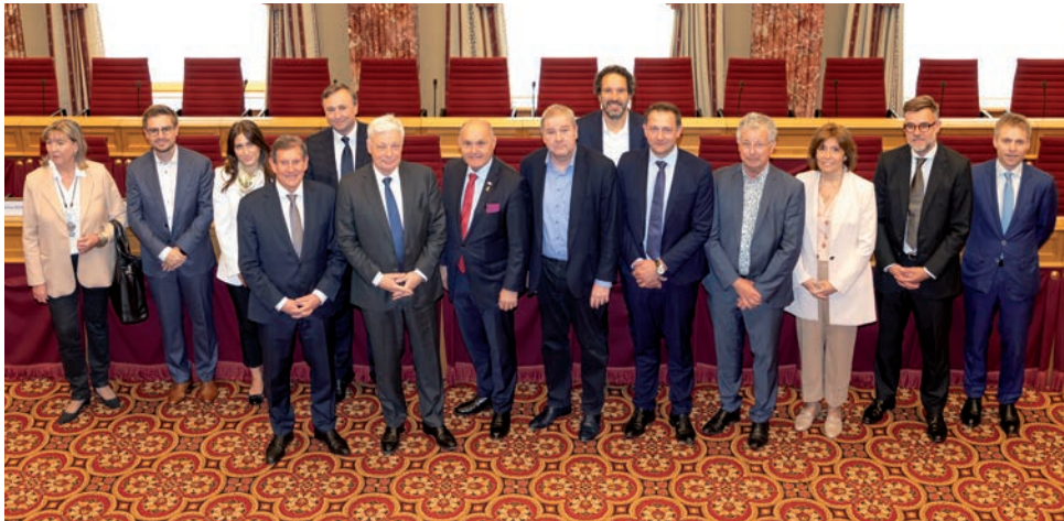
Le Président du Conseil national de la République d'Autriche, M. Wolfgang Sobotka (7 e à gauche), a été reçu à la Chambre des Députés.

M. Wolfgang Sobotka, Président du Conseil national de la République d'Autriche, a été reçu le 7 mai 2024 à la Chambre des Députés pour un échange autour de plusieurs thèmes de l'actualité politique.