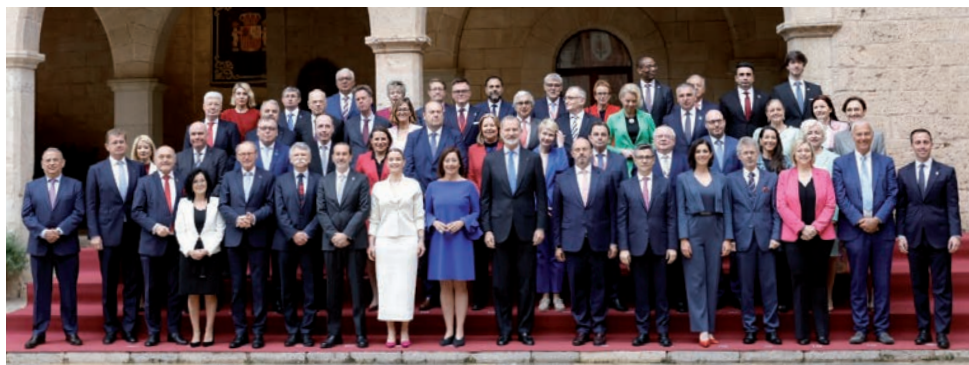
Le Sommet des Présidents des Parlements des 27 États membres de l'UE s'est tenu cette année à Palma de Majorque dans le contexte de la présidence espagnole du Conseil de l'UE.

M. Claude Wiseler, Président de la Chambre des Députés, a participé au Sommet des Présidents des Parlements des 27 États membres de l'Union européenne, qui s'est tenu les 22 et 23 avril 2024 à Palma de Majorque. Face aux différents conflits qui entourent l'Union européenne, tels que l'invasion de l'Ukraine par la Russie ou encore le conflit au Moyen-Orient, les Présidents des Parlements des 27 États membres de l'UE ont discuté de l'autonomie stratégique de l'UE et de sa politique étrangère et de défense.