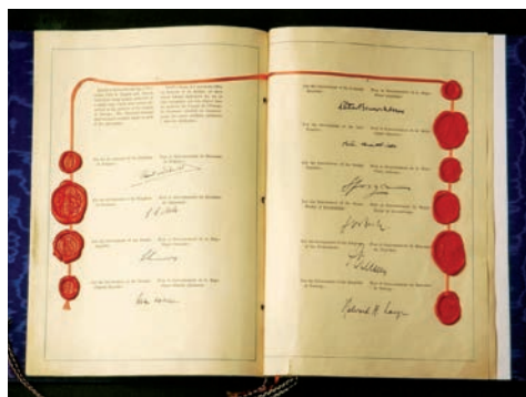
Le Traité de Londres signé par le Ministre des Affaires étrangères Joseph Bech

Le 5 mai 1949, la Belgique, le Danemark, la France, l'Irlande, l'Italie, la Norvège, les Pays-Bas, le Royaume-Uni, la Suède et le Luxembourg ont signé le Traité de Londres instituant le Conseil de l'Europe. Le Ministre des Affaires étrangères de l'époque, M. Joseph Bech, y a apposé sa signature pour le Grand-Duché. Cette organisation emblématique s'est donné comme but la défense des valeurs démocratiques et des droits de l'homme.