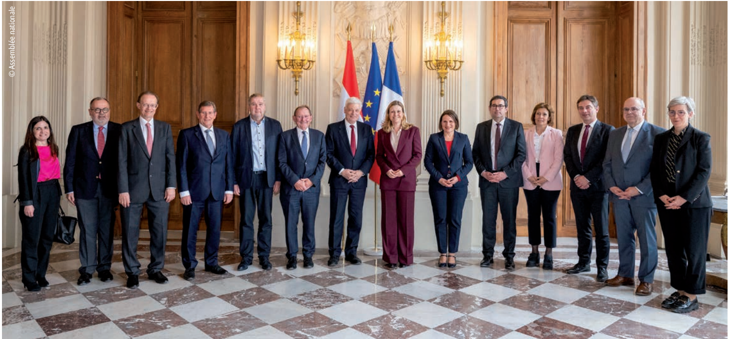
La délégation luxembourgeoise a été reçue par la Présidente de l'Assemblée nationale, Mme Yaël Braun-Pivet (au milieu), à l'Hôtel de Lassay à Paris.

Une délégation de la Chambre des Députés s'est rendue à Paris le 30 avril 2024 pour y rencontrer la Présidente de l'Assemblée nationale, Mme Yaël Braun-Pivet, à l'Hôtel de Lassay à l'occasion d'une visite de travail.